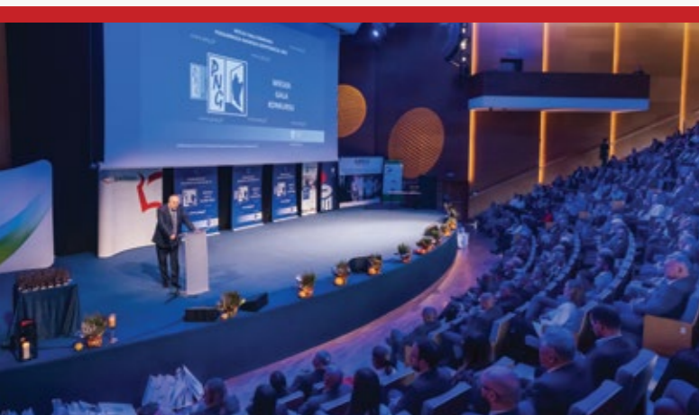
Powitanie licznie przybyłych gości przez Pawła Zajęca - Prezesa Centrum Promocji Biznesu