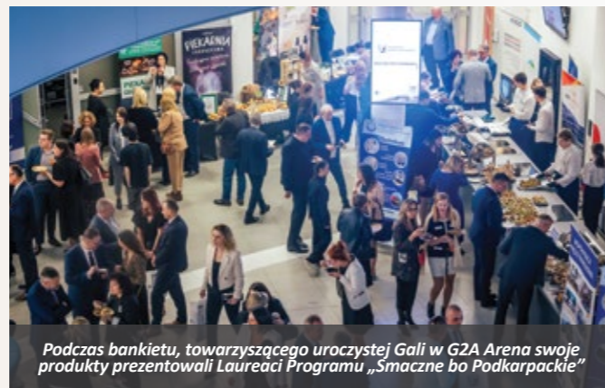
Podczas bankietu, towarzyszącego uroczystej Galii w G2A Arena swoje produkty prezentowali Laureaci Programu „Smaczne bo Podkarpackie”