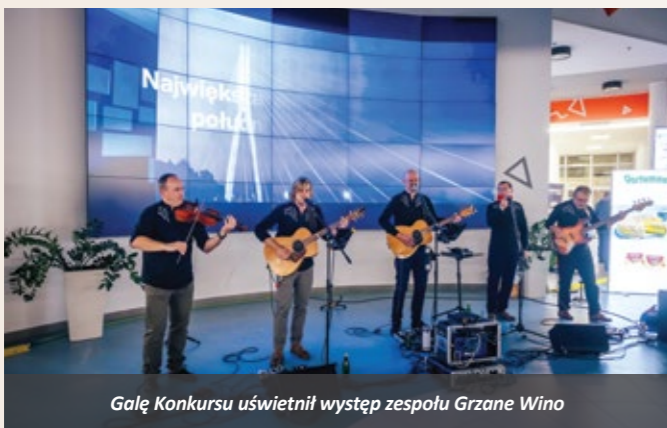
Gałę Konkursu uświetnił występ zespołu Grzane Wino

Usługi budowlane na terenie kraju BESTA PRZEDSIĘBIORSTWO BUDOWLANE Sp. z o.o., Rzeszów