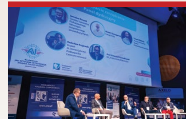
Poprzedzająca wręczenia nagród w Konkursie Podkarpacka Nagroda Gospodarcza konferencja na temat sztucznej inteligencji połączyła naukę z biznesem. Organizatorami konferencji były Izba Podkarpacki Samorząd Gospodarczy oraz Politechnika Rzeszowska